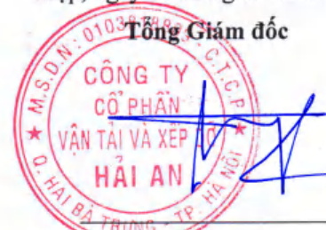
Tạ Mạnh Cường