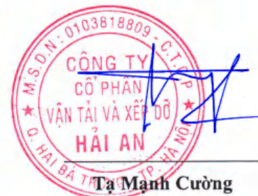
Tạ Mạnh Cường